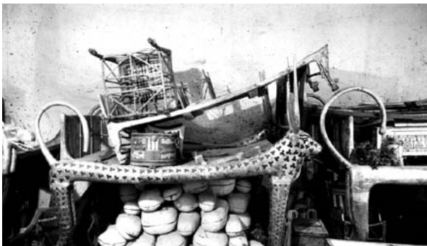
Bild av ceremoniella sängar i förrummet

Howard Carter misstänkte att Tutankhamuns grav skulle finnas under ruinerna av hyddorna som byggnadsarbetarna som byggde Ramses VI:s grav i Konungarnas dal bodde i.