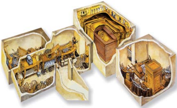
Ritning av graven

Howard Carter misstänkte att Tutankhamuns grav skulle finnas under ruinerna av hyddorna som byggnadsarbetarna som byggde Ramses VI:s grav i Konungarnas dal bodde i.