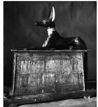
Skrin med Anubis

En annan gravkammare som är känd som skattkammaren användes huvudsakligen för att förvara begravningsföremål. Där hittades bland annat ett kanopskrin och ett skrin med guden Anubis. I sidokammaren fanns en samling olika bägare, oljeflaskor, möbler och korgar med frukt.