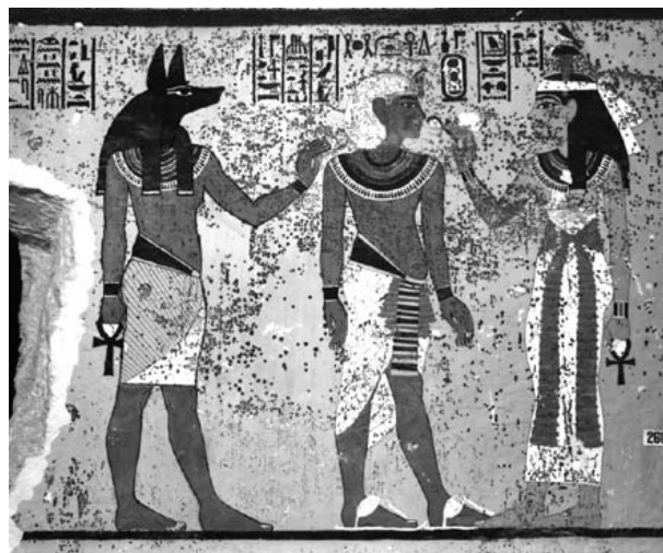
Fresk på gravkammarens sydliga vägg. Tutankhamun i mitten med guden Anubis till vänster får symbolen för "liv" av gudinnan Hathor.

Några av de sista faraonerna som styrde under den 18:e dynastin var den höge prästen Ay och general Horemheb. Under Horemheb och hans efterträdare förstördes många av Amarnaperiodens monument och statyer, tyvärr även sådant som vittnade om