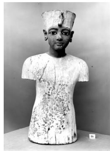
Trästaty av Tutankhamun

över ett rike som sträckte sig längs Nilen från Medelhavet till Nubien, och ända fram till Mesopotamien. I Konungarnas dal i De dödas stad (nekropol) på västra sidan av Nilen mitt emot Thebe begravdes nästan alla kungar som härskade under Nya riket. Den