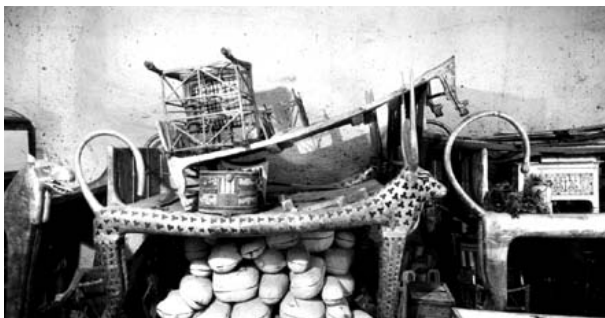
Bild av ceremoniella sängar i förrummet

Skolmaterialet är tänkt att användas som ett komplement till materialet som visas på utställningen. Alla utställningsföremål är exakta, handgjorda kopior av de ursprungliga föremålen i Tutankhamuns grav, som det har tagit egyptiska konsthantverkare många års hårt arbete att återskapa. Resultatet är unika föremål med vilka man har lyckats återskapa graven som den såg ut när Howard Carter upptäckte den år 1922. Med hjälp av alla gravföremål kan man visa livet i det gamla Egypten och faraonernas styre på ett mycket levande sätt.