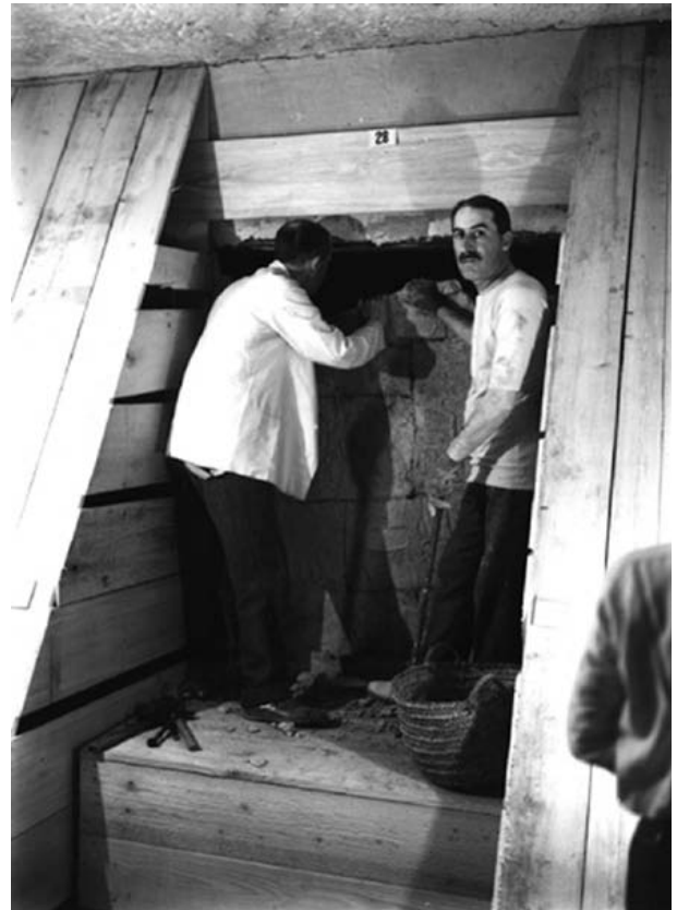
Howard Carter arbetar vid gravkammaren

Carnarvon frågade Carter om han kunde se något. Carter svarade med de berömda orden: ”Ja, underbara ting.” Teamet förstod snart att de hade upptäckt Tutankhamuns grav. Första artikeln om upptäckten av graven publicerades den 30 november i den brittiska dagstidningen The Times och upptäckten hyllades som en sensation i media över hela världen. Howard Carter samlade omedelbart en grupp experter som först gjorde en vetenskaplig katalogisering av gravkammarna och sedan tömde dem. Arbetet tog 10 år. Utställningen ”Tutankhamun – Graven och skatterna” visar gravkammarna som de såg ut när Howard Carter och lord Carnarvon hittade dem.